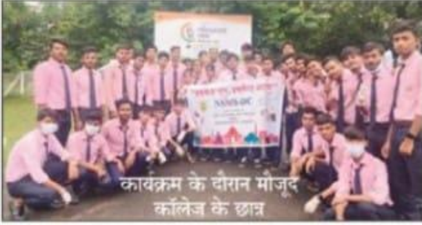
कार्यक्रम के दौरान मौजूद कॉलेज के छात्र

दुर्गापुर। दुर्गापुर शहर के एक नंबर वार्ड अंतर्गत कमलपुर ग्राम स्थित नेशनल स्कूल आफ मैनेजमेंट स्टडीज