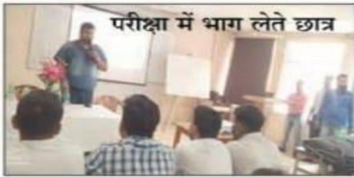
परीक्षा में भाग लेते छात्र

दुर्गापुर प्रतिनिधि। दुर्गापुर शहर के कमलपुर स्थित शांति निकेतन पॉलिटेक्निक कॉलेज में बुधवार चेन्नई के सीएट कंपनी द्वारा छात्रों का प्लेसमेंट हेतु पुल कैम्पस ड्राइव कार्यक्रम का आयोजन किया गया, जहां राज्य भर के विभिन्न जिलों के सरकारी एवं प्राइवेट कॉलेज से सैकड़ों छात्रों ने इंटरव्यू के लिए भाग लिया। कंपनी की ओर से